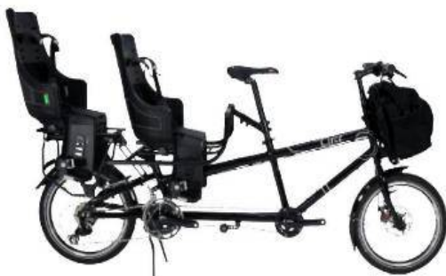
Configuration 2 bébés et 1 adulte

Les vélos multi-passagers de type tandems à 2 ou 3 places existent dans de multiples configurations pour adultes, enfants de tout ages. Certains modèles sont mêmes modulables.