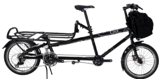
Configuration transport charges lourdes et encombrantes