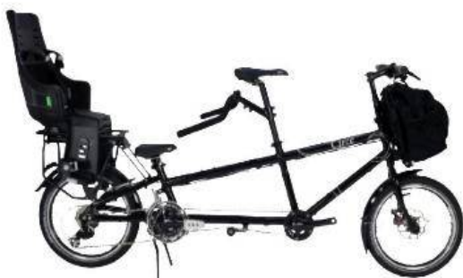
Configuration bébé, enfant et adulte